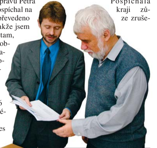
To je můj rozvrh hodin, pane řediteli? Miloš Vystrčil se chystá mezi studenty.

Cesta do krajské rady vedla u Miloše Vystrčila přes telčskou starostovskou židli. Ještě předtím ale učil na místním gymnáziu, a tak je nyní k máni zase mezi studenty: „Supluji za chybějící profesory, byl jsem také v hodinách společenskovedního semináře a společenské výchovy, kde jsem přednášel o fungování samospráv, hlavně samosprávy krajské. Učím fyziku, možná budu suplovat i matematiku. Zítřka mne čeká například výuka proměnného magnetického pole, magnetický indukční tok a věci s tím spojené a velmi se na to těším, protože mezi dětmi je hezky,“ řekl Kraji Vysočina Miloš Vystrčil v rychlosti na chodbě.